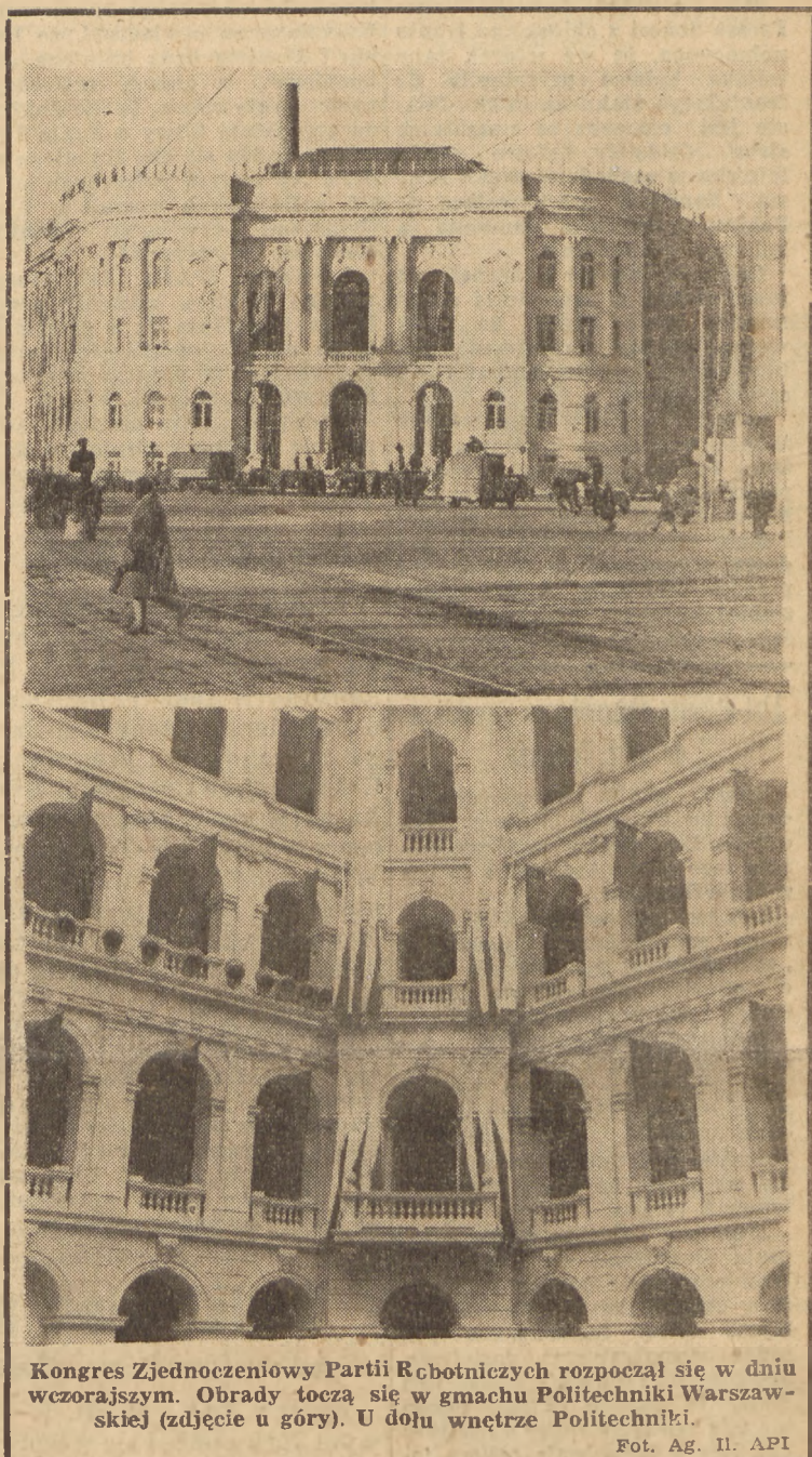
Kongres Zjednoczeniowy Partii Robotniczych rozpoczął się w dniu wczorajszym. Obrady toczą się w gmachu Politechniki Warszawskiej (zdjęcie u góry). U dołu wnętrze Politechniki.

Na specjalne podkreślenie zasługuje dekoracja sali. Czerwień sztandarów odbija się od bieli krążanków a tło stanowi czerwony dywan pokrywający liczącą blisko 1000 m kw. płaszczyznę marmurowej podłogi. Podium przeznaczone dla prezydium Kongresu udekorowane jest artystycznie udrapowanymi sztandarami.