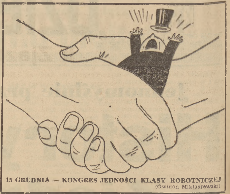
15 GRUDNIA — KONGRES JEDNOŚCI KLASY ROBOTNICZEJ (Gwidon Miklaszewski)

Bytom (tel. wł.). W dniu 14 bm. o godz. 14.30 Śląskie Zakłady Przemysłowe w Tarnowskich Górach, produkujące maszyny narzędzia, wykonały roczny plan produkcji.