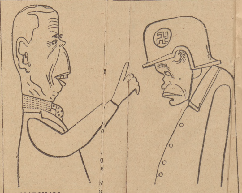
MARSHALL: A więc uważa. Z dniem 1 kwietnia rozpoczynamy nową fazę w stosunku do Niemiec. Zabezpieczamy pokój. Przeprowadzamy likwidację, demilitaryzację, rozwiązujemy Bizonię, wypłacamy odszkodowania. Wszyscy przestępcy wojenni pójdą pod klucz. Tylko ci, którzy w demokracji będą mogli uczestniczyć w budowie nowych

Wśród śmiertelnych ofiar katastrofy przeważają podobno członkowie tzw. „arabskiej armii wyzwolitej“. Kraża pogłoski, że katastrofę spowodowali terroryści z grupy Sterna.