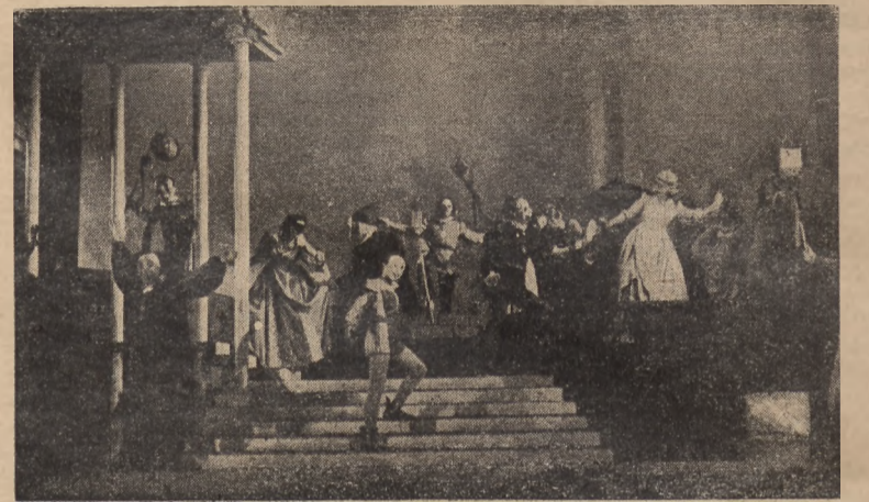
Szelespira „Wiele hałasu o nic” w Państwowym Teatrze Polskim w Szczecinie w reż. i inscenizacji Zbigniewa Sawana; dekoracje projektu Wojciecha Zamecznika wykonał Tadeusz Rajkowski. Na zdjęciu scena z aktu II.

Na marginesie tego bardzo dobrego przedstawienia zanotować należy cenne uświadczenia kierownictwa Teatru Polskiego przeniesienia zainteresowań teatralnych także poza ramy przedstawienia. Dyskusja zainicjowana w Świećlickim Artystycznym zakończyła się wprawdzie fiaskiem, ale daleko bardziej celowe niż elitarne spotkania, wydają mi się rozmowy z „nowym widzem” nie krepulacym się i nie zepsutym. A także nie rozgrymaszonym. Tak. Bo chyba tylko w Szczecinie mógł zdarzyć się wypadek, że pewne pismo z jakichś tam powodów — mniejsza o to czy słusznych czy nie — obrazowy się na dyrekcję państwowego placówki, urzędu przyniosło na Szekszipra, wykonawców, personel, teatr w ogóle, zachowując „na złoto matulii” uprzejme milczenie o tym udanym „pierwszym kroku” Państwowego Teatru Polskiego w Szczecinie.