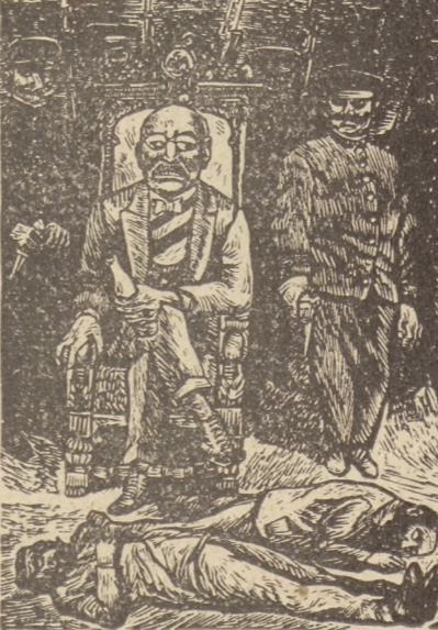
Alfredo Zalce — Uzurpator