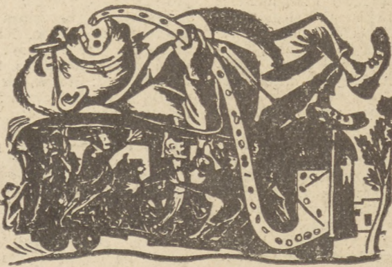
José Morado — Rysunek satyryczny — (drzeworyt)