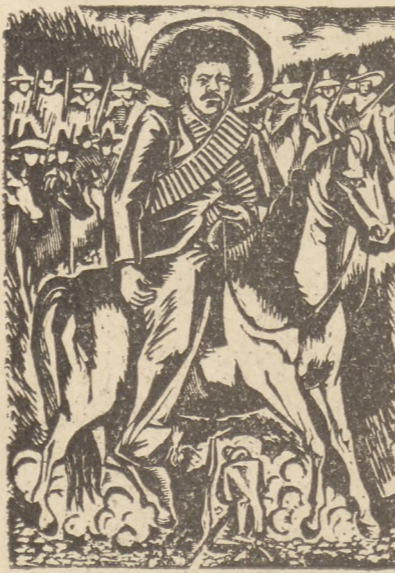
Leopold Mendez — Pancho Villa (drzeworyt)