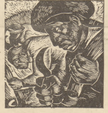
Eduardo Kingman — Zbże (drzeworyt)