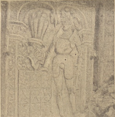
GROBOWIEC PIASTOWSKIEGO KSIĘCIA