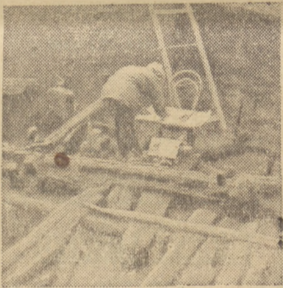
PRASŁOWIAŃSKIE GRODZISKO W SZCZECINIE