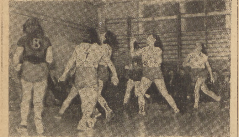
W czasie Świąt przybyła do Warszawy reprezentacja Czechosłowacji w koszykówce pań, która pokonała kolejno reprezentację Polski, repoz. Warszawy i repoz. Łodzi. Na zdjęciu fragment meczu Polska — Czechosłowacja.