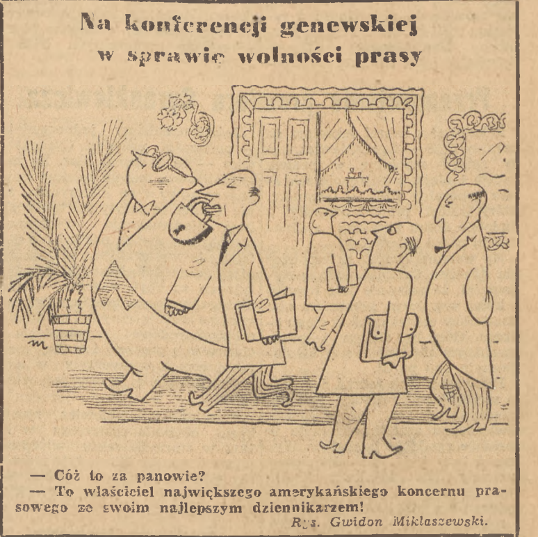
Na konferencji genewskiej w sprawie wolności prasy — Cóż to za panowie? — To właściciel największego amerykańskiego koncernu prasowego ze swoim najlepszym dziennikarzem! Rys. Gwidon Miklaszewski.

Projektowane prace obejmą przebiegnięcie 13 km linii wysokiego napięcia w gminie Domeniewice, 12 km linii tego samego typu w gminie Kierozia, 16 km linii w gminie Bielawy i 10 km linii wysokiego napięcia w gminie Lubianów. Dzięki tym pracom zelektryfikowanych będzie dalszych 36 gromad.