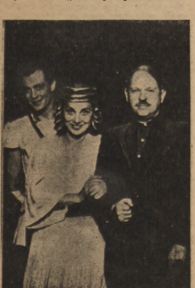
„Fedra“ Racine'a w Poznaniu

„Fedra“ Racine'a w Teatrze Polskim w Poznaniu. Dekoracje Jana Koscińskiego