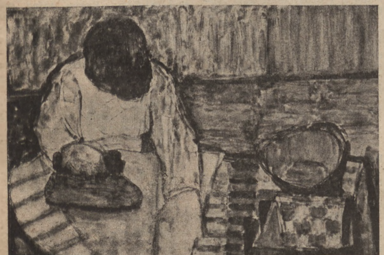
Maksymilian Kasprowic: Prasowaczka.