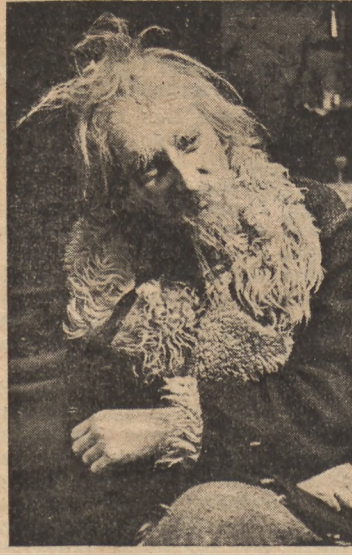
GUSTAW HOLOUBEK jako Pierzyczyn