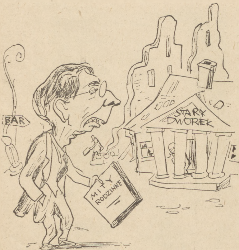
ADAM WAŻYK – Bankierzy ruin