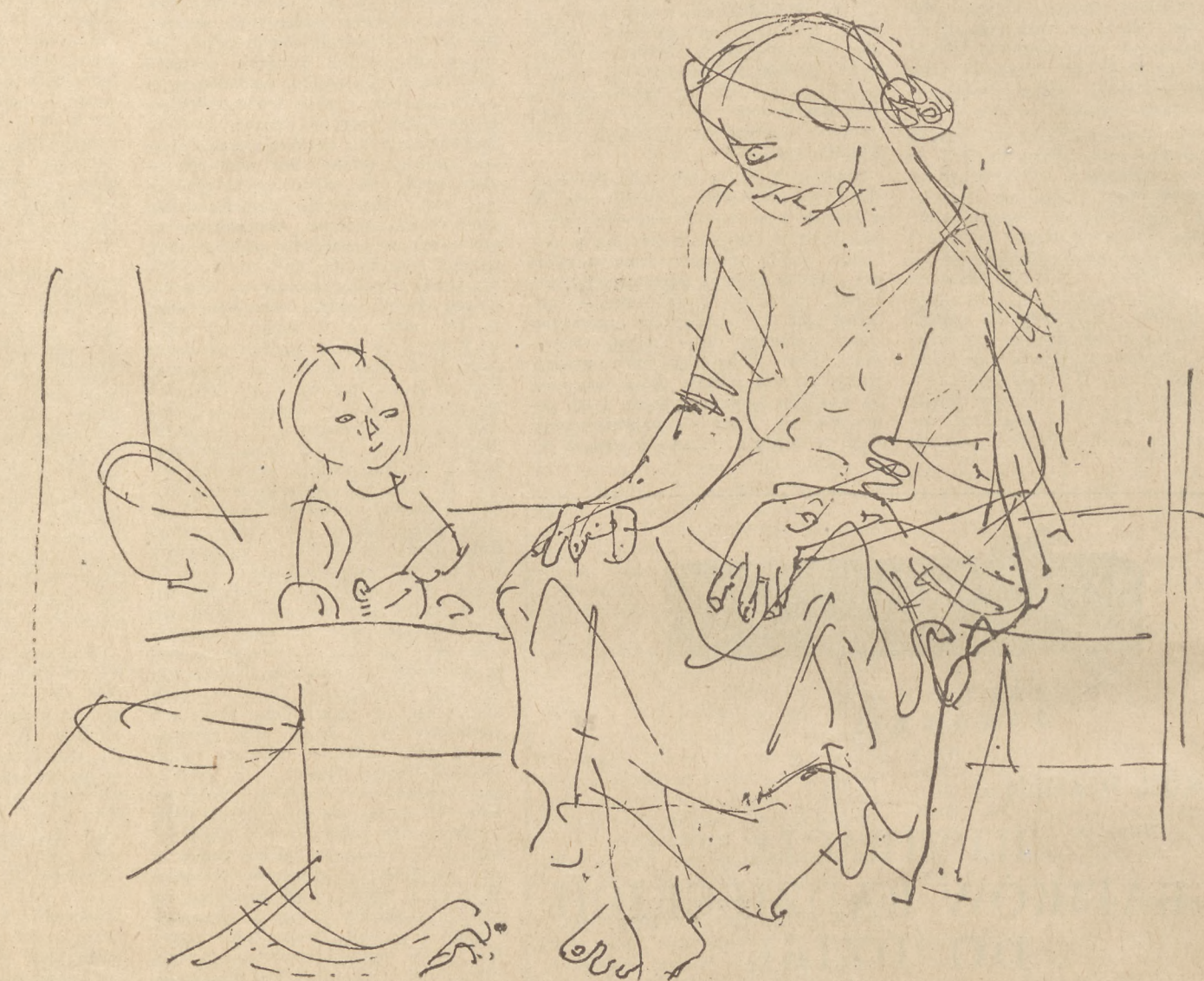
Matka: rysunek, pióro tusz.