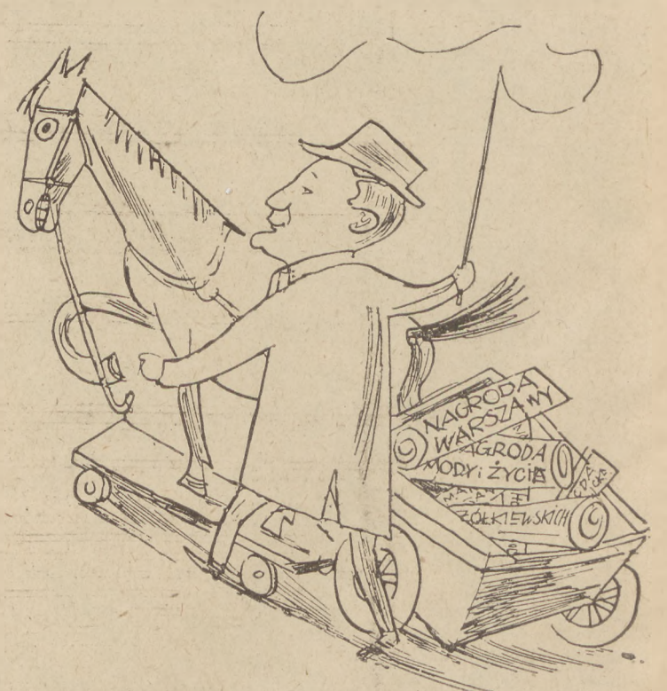
KAZIMIERZ BRANDYS – Koń niepokonany