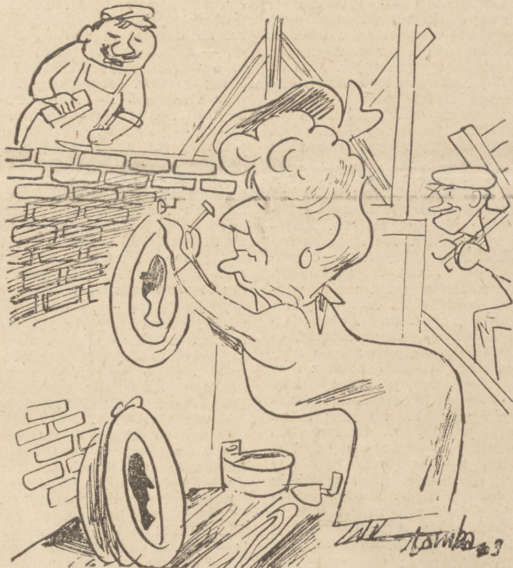
ZOFIA NAŁKOWSKA – Medaliony