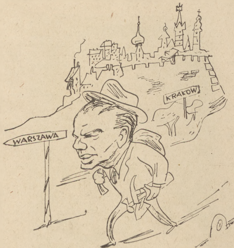
WOJCIECH ZUKROWSKI – Z kraju milczenia