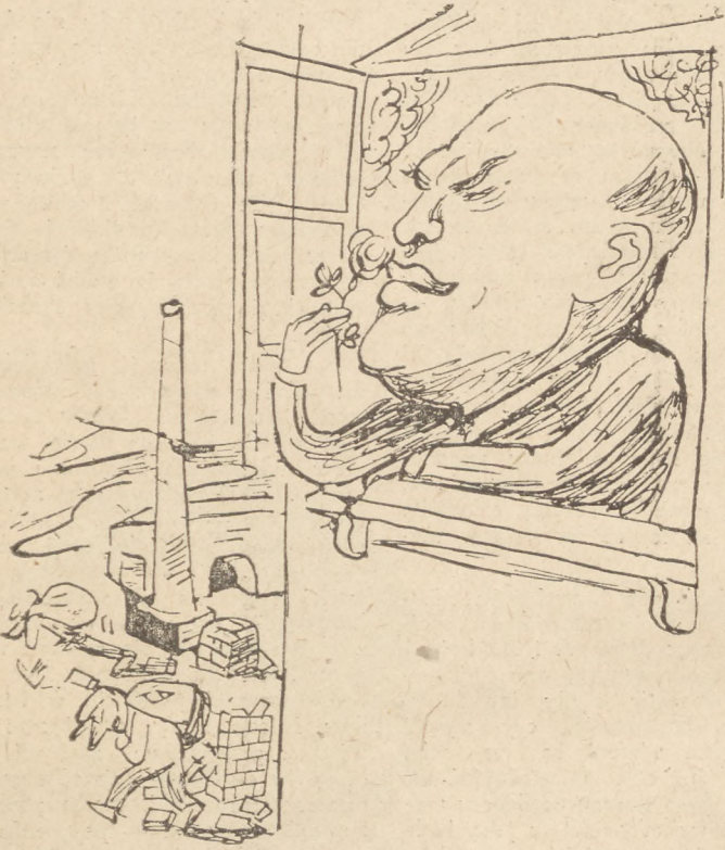
JAROSŁAW IWASZKIEWICZ – Stara cegielnia