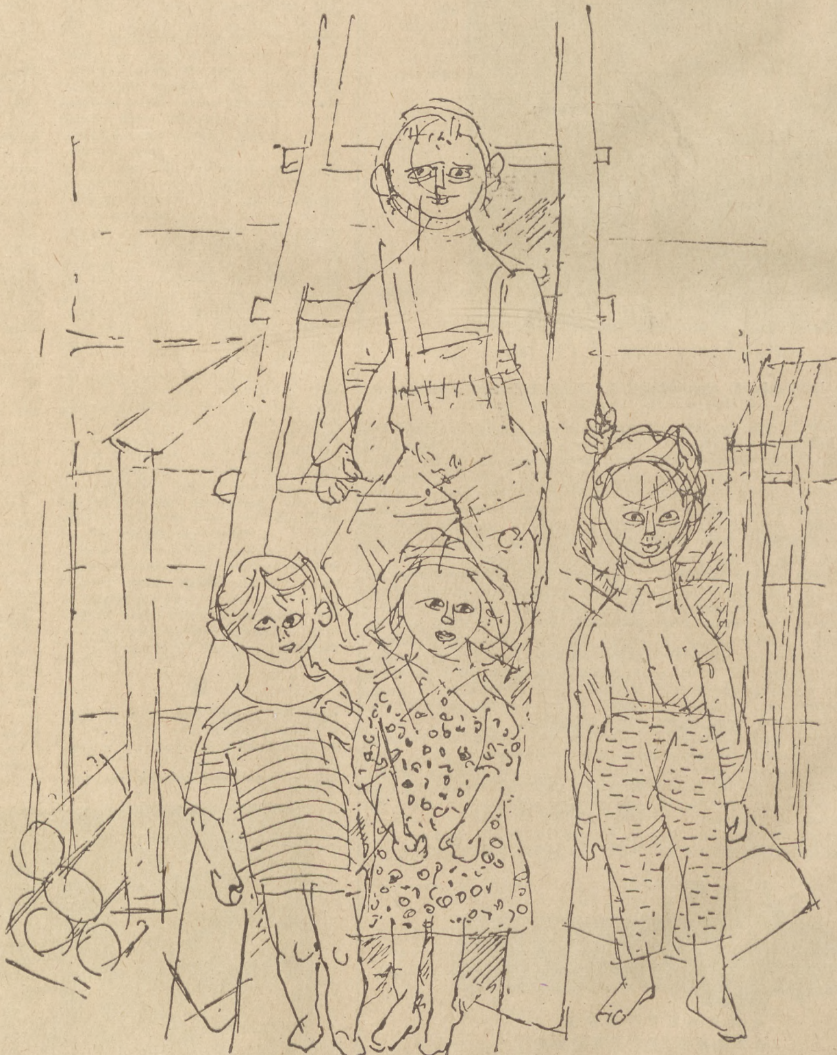
Dzieci: rysunek, pióro-tusz.