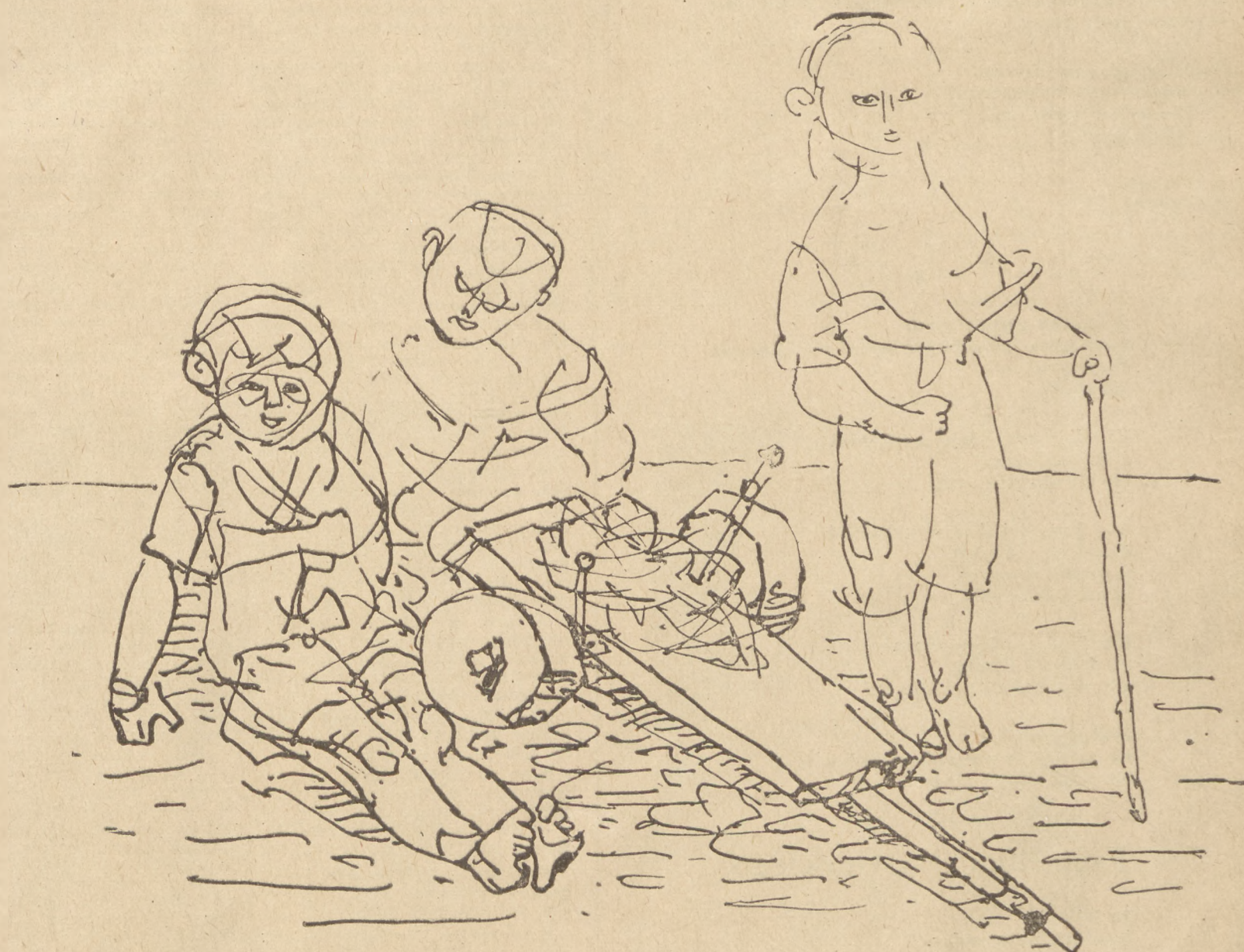
Dzieci z wózkem: rysunek, pióro-tusz