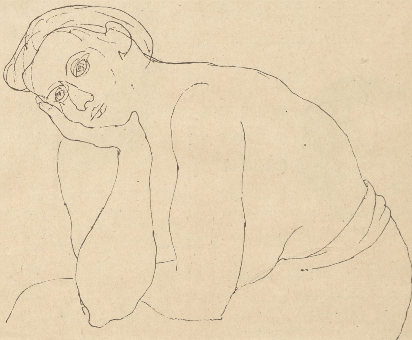
Portret kobiety: rysunek, pióro-tusz