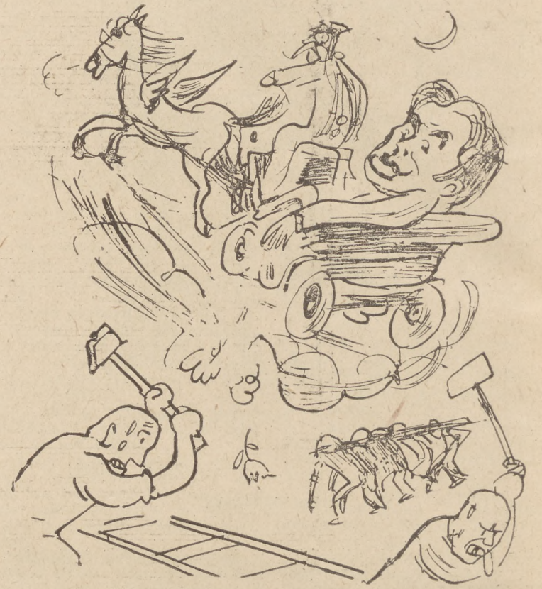
KONSTANTY I. GAŁCZYŃSKI – Z zaczarowanej dorczki kwiaty rzucam na tor...