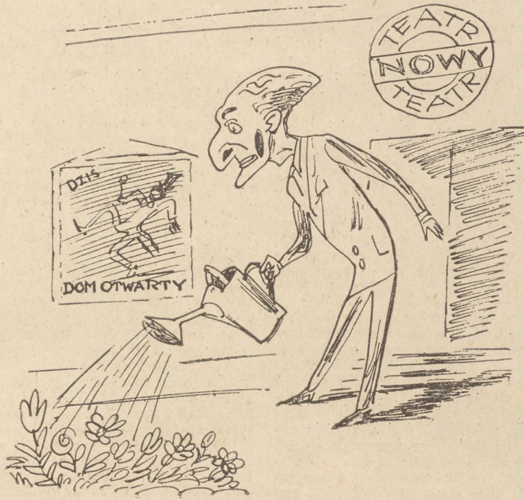
JULIAN TUWIM – Kwiaty Polskie