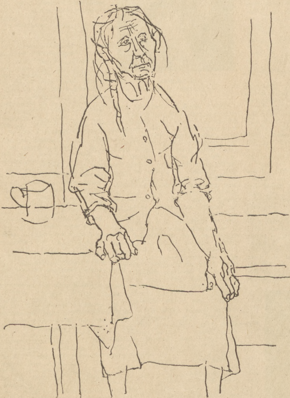
Stara kobieta: rysunek, pióro-tusz.