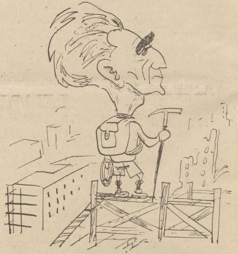
MIECZYŚLAW JASTRUN – Sezon w Alpach