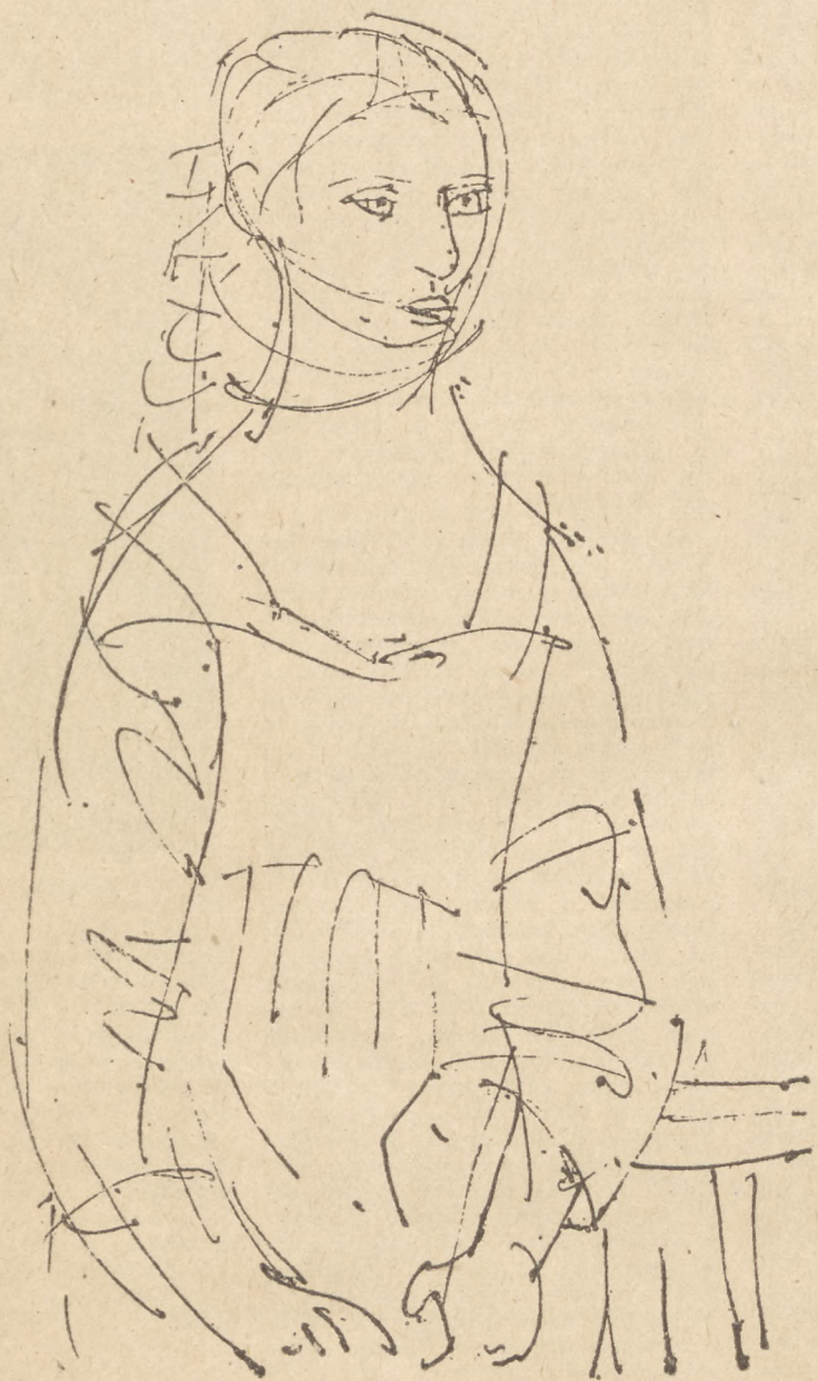
Portret dziewczynki. rysunek, pióro tusz.