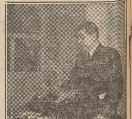
Na zdjęciu: prezydent Akademii Nauk ZSRR Sergiusz Wawilow.