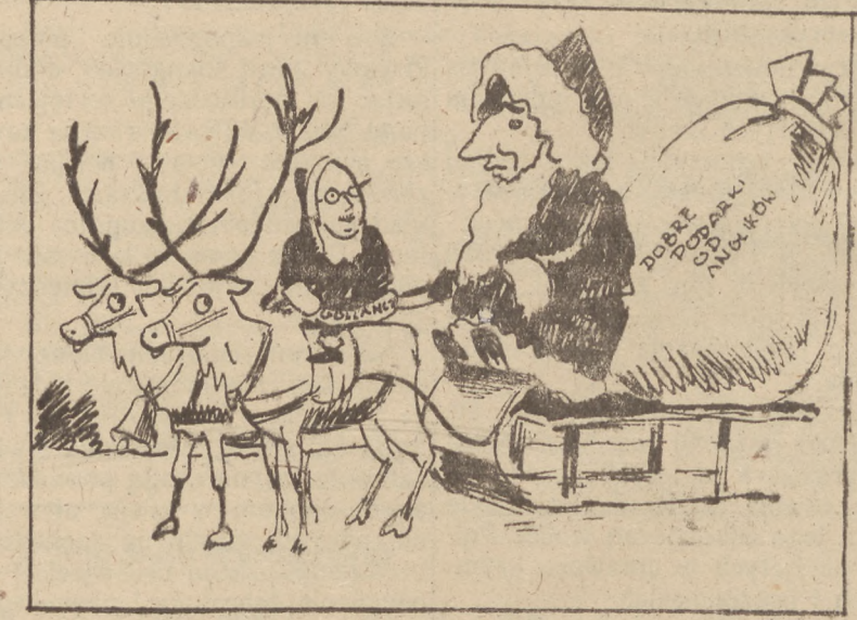
Angielski św. Mikołaj jedzie do Niemiec