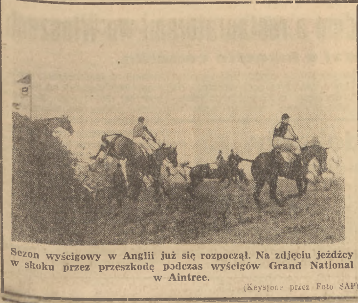
Sezon wyścigowy w Anglii już się rozpoczął. Na zdjęciu jeźdźcy w skoku przez przeszkodę podczas wyścigów Grand National w Aintree.

5. Przewidziane zostały dla Polaków D. P. w strefie brytyjskiej organizacje kulturalne i dobroczynności, do których przystęp mają agencje wrocy Rządów Polskimi i rozsiewają antypolską propagandę. Dlatego domagamy się, ażeby te organizacje były uzgodnione z nami i żeby w nich znaleźli się nasi reprezentanci.