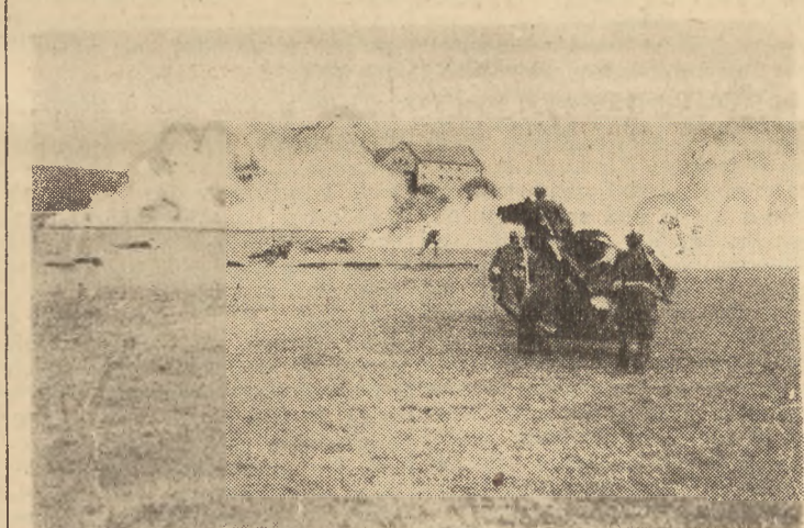
Fragm. natarcia na Rottenburg.