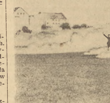
„Niezwyliczeni” kapitulują... Archiwum 7 Łużyckiej Dywizji Piechoty.

powołania się nieprzyjaciela do natarcia i do ewentualnego sforsowania rzeki Nysy, przystawiono ogień zaporowy na zachodnim brzegu rzeki. Nieprzyjacieli zaciekle bronili zachodniego brzegu rzeki Nysy, zwracając szczególną uwagę na m. Lodenau.