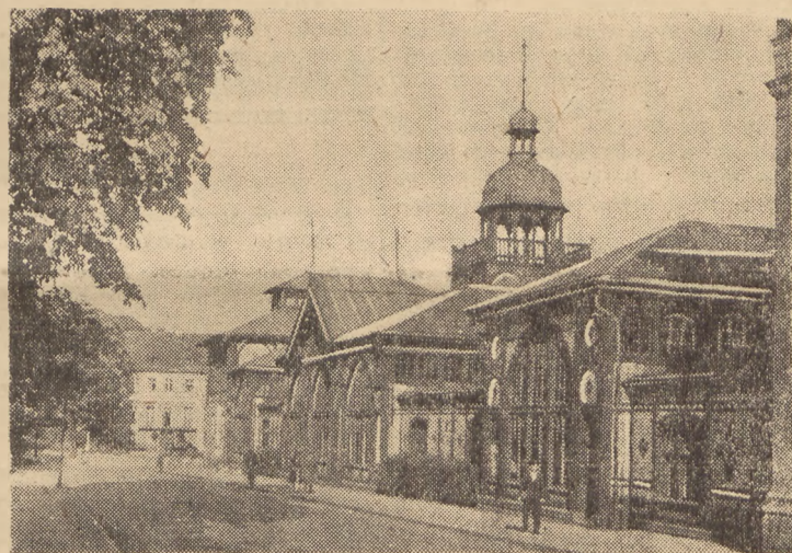
Pijalnia wód w Solicach-Zdroju.

Jednym z najciekawszych uzdrowisk jest Łądek Zdrój, w sanatoriach którego leczą się na razie oficerowie radzieccy ranni w walkach z Niemcami. Do dyspozycji ogólnej dla gości krajowych