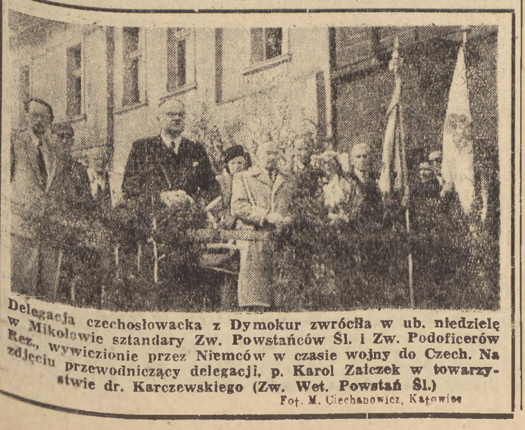
Delegacja czechosłowacka z Dymokur zwróciła w ub. niedzielę w Mikołowie szlany Zw. Powstańców Śl. i Zw. Podoficerów Rez. wywiezione przez Niemców w czasie wojny do Czech.