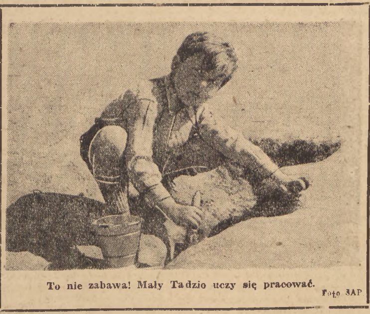
To nie zabawa! Mały Tazio uczy się pracować.

Częstochowa. W kwietniu zm. zmarło w Częstochowie 130 osób. W tym samym okresie przyszło na świat 257 nowych obywateli. Przyrost naturalny wynosił zatem w ub. miesiącu 127 osób. W kwietniu w Urzędzie Stanu Cywilnego zawarto 127 związków małżeńskich.