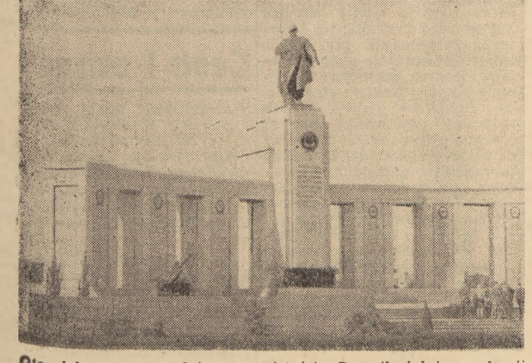
Oto dokument twardej rzeczywistości: Pomnik żołnierzom Armii Czerwonej w Berlinie

Rozpryskiem salw armatnich, Wzburzoną zielenią — Plomieniem serc i żarem wiosennej radości, Pozdrawiam ciebie maju