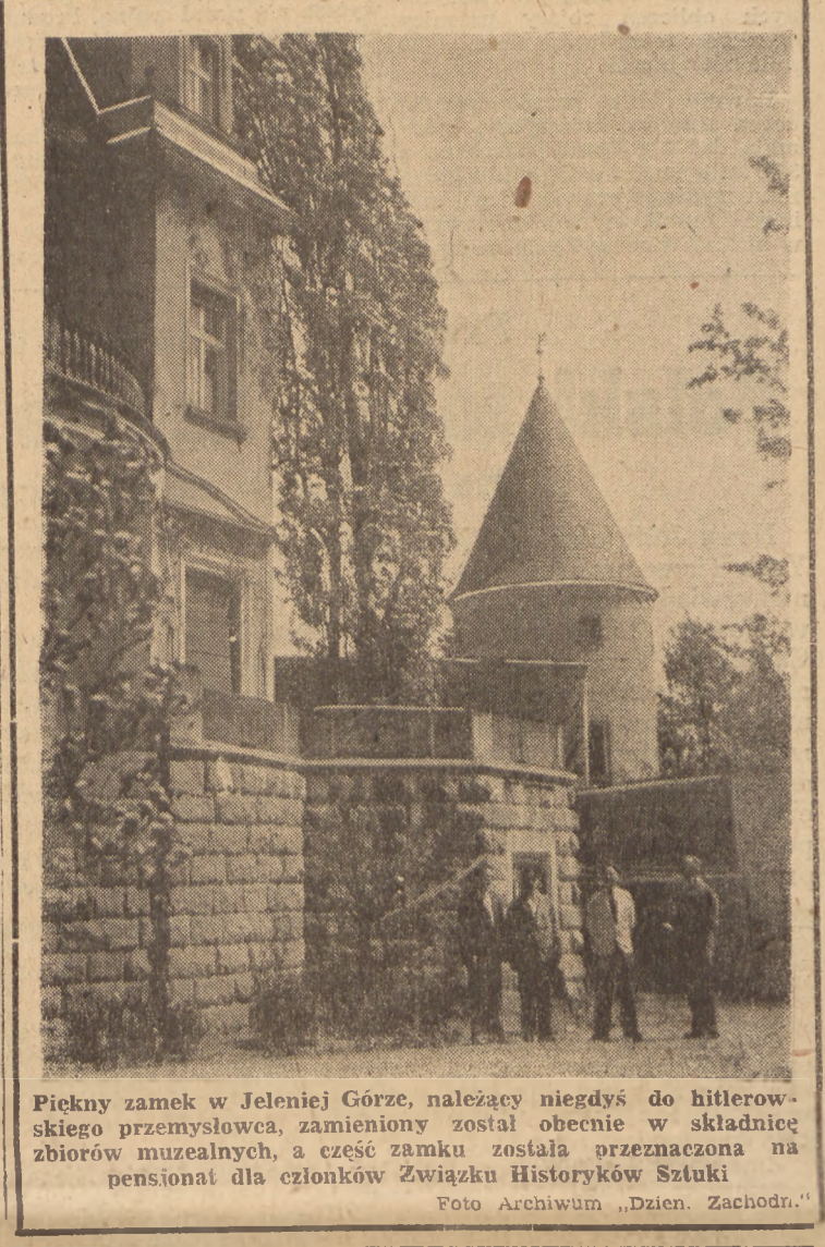
Piękny zamek w Jeleniej Górze, należący niegdyś do hitlerowskiego przemysłowca, zamieniony został obecnie w składnicę zbiorów muzealnych, a część zamku została przeznaczona na pensjonat dla członków Związku Historyków Sztuki

W dalszym ciągu zebrania przedstawieli wszystkich partii politycznych i organizacji zadeklarowali swój udział w akcji kontrolnej na terenie całego województwa. W toku dyskusji wyjaśniono istotę i sposoby walki z drożyzną