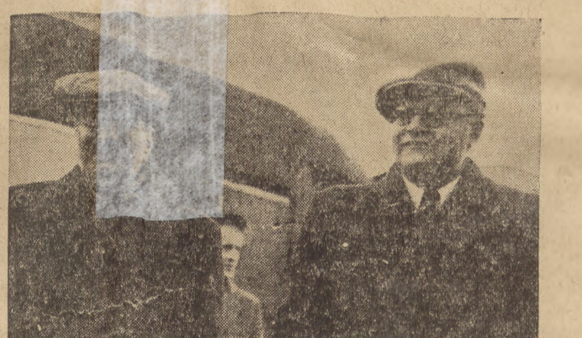
Przyjazd delegacji rumuńskiej na dworzec Główny w Warszawie. Na zdjęciu od prawej sekretarz Partii Komunistycznej Constantinescu (Rumunia).