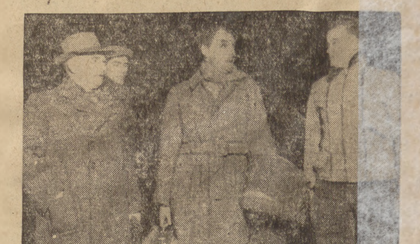
Delegaci belgijscy przybyli do Warszawy na Kongres Zjednoczonej Klasy Robotniczej. Na zdjęciu delegacja z przewodnikiem na dworcem Głównym Warszawy.