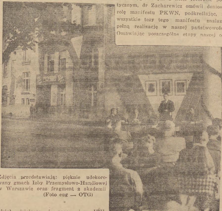
Zdjęcia przedstawiają: pięknie udekorowany gmach Izby Przemysłowo-Handlowej w Warszawie oraz fragment z akademii

W wygłoszonym z kolei referacie politycznym, dr Zacharewicz omówił doniosłą rolę manifestu PKWN, podkreślając, że wszystkie tezy tego manifestu znalazły pełną realizację w naszej państwowości. Omawiając poszczególne etapy naszej od-