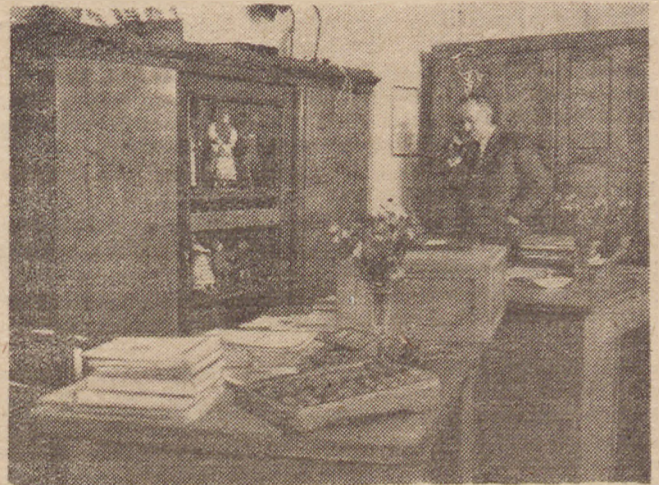
Biuro Warsztatów Przysposobienia i Doskonalenia Zawodowego.

Trzecim wreszcie działem pracy są Warsztaty szkoleniowe. Warsztaty te, dysponujące już dość poważnym parkiem maszynowym (warsztaty tkackie), maszyny do szycia, maszyny trykotarskie itp.) stanowią — z jednej strony ośrodek praktycznego szkolenia kursistów — z drugiej produkują pewne artykuły, jak