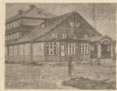
Schronisko im. Stanisława Wyspiańskiego pod Śnieżką 1400 m n. p. m. — czynne cały rok

PRENUMERATA „POLSKI ZACHODNIEJ” PRZEZ POCZTĘ Zawiadamiamy, że od 1 do 15 każdego miesiąca wszystkie urzędy pocztowe na terenie całej Polski przyjmują zamówienia na prenumeratę „Polski Zachodniej”.