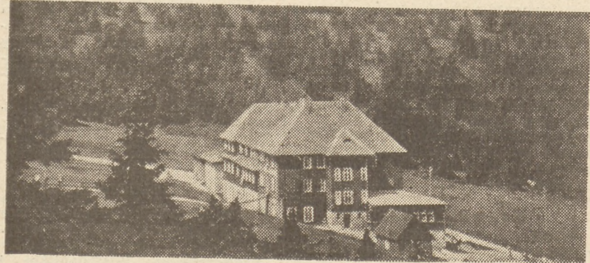
Schronisko im. Jana Kasprowicza pod Szrenicą 1195 m n. p. m. — czynne cały rok

Nie wątpimy ani na chwilę — kończy swe wywody dyrektor Sobański, — że praca nasza nie pójdzie na marne i w lecie br. nasze uzdrowiska zapełnią się cudzoziemcami, a przede wszystkim mieszkańcami Skandynawii. (St. Stan)