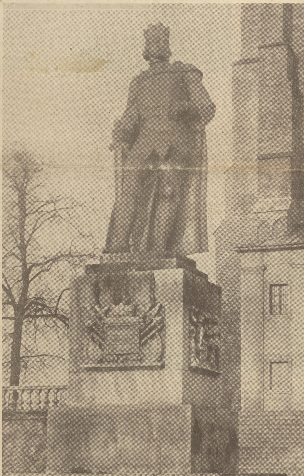
Pomnik Bolesława Chrobrego w Gnieźnie przed Bazyliką (zniszczony przez Niemców podczas okupacji)

Pomoc ofiarom powodzi - to obowiązek obywatelski