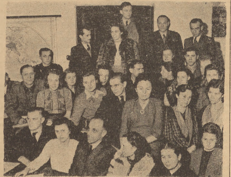
Uczestnicy kursu przodowników czytelnictwa.