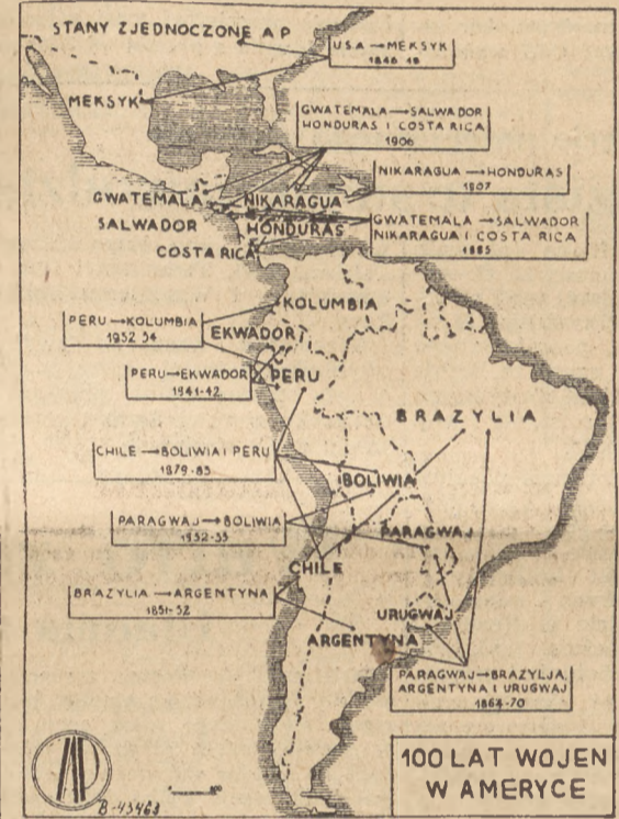
100 LAT WOJEN W AMERYCE

czy republiki łańciskiej. Duże różnice zapatrywań wywołują też problem wspólnej organizacji wojskowej republik łacińskich. Jej skład i zasięg władzy w wypadku agresji ze strony sąsiada.