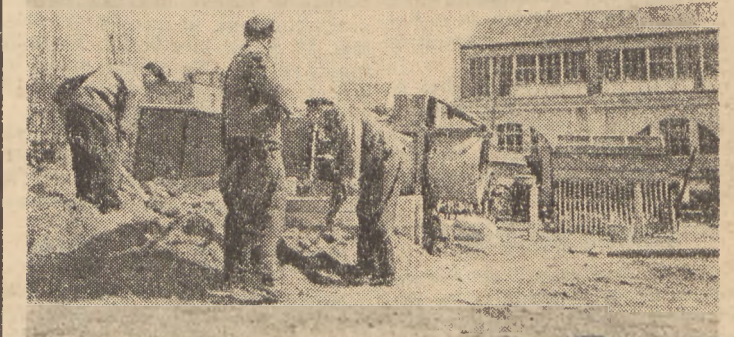
Przygotowania do drugich powojennych Międzynarodowych Targów Poznańskich są w pełnym toku. Wiele państw zgłosiło już swój udział w Wystawie, która wykaże nasz dorobek gospodarczy po wojnie.

W tym stanie rzeczy Zw. Radziecki opublikuje tajne dokumenty dyplomatyczne, znajdujące się w jego posiadaniu, a dotyczące stosunku rządów W. Brytanii, Stanów Zjednoczonych i Francji z reżimem hitlerowskim. Temu samemu celowi służyć będzie publikacja innych dokumentów pod tyt. „Fałszerstwo historii”.