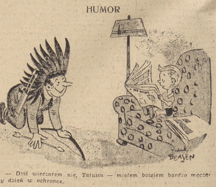
— Dziś wieczorem nie, Tatusiu — miałem bowiem bardzo męczący dzień w ochronce.