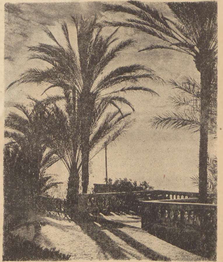
WSCHÓD SŁONCA NA RIWIERZE

Słońce wschodzi nad Riwierą. Co dzień przyniesie? Nowe ograniczenia i nowe trudności? Szukajmy ucieczki w kartkowym winie...