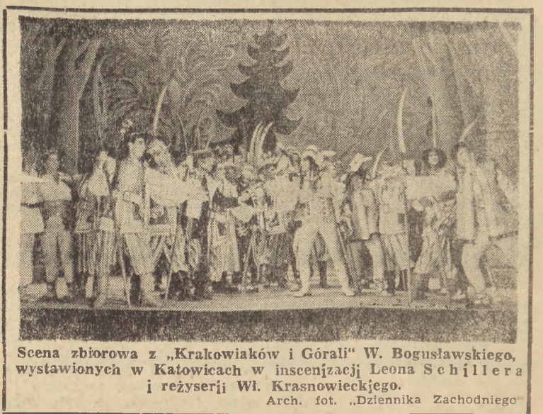
Scena zbiorowa z „Kraśniaków i Górali” W. Bogusławskiego, wystawionych w Katowicach w inscenizacji Leona Schillera i reżyserji Wł. Krasnowieckiego.