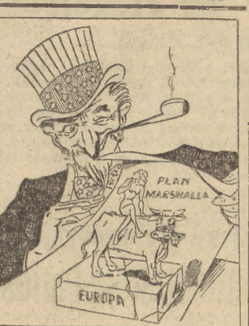
— Nie bój się, nie ci nie zrobię, tylko cię w to zapakuję!