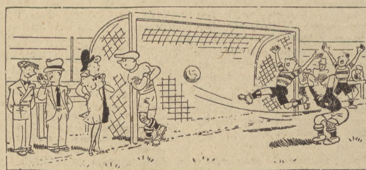
— Czy teraz wiesz, dlaczego poznałem moją śliczną siostrę z bramkarzem drużyny przeciwników?