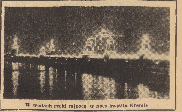
W wodach rzeki migoczą w nocy światła Kremļa

ku — przechodnym sztandarem pracy. Huta „Malapanew” na to zasługuje! (KABE)