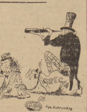
Anglosascy opiekunowie: Nie pozwolimy, aby ktoś naruszył niepodległość Grecji! (Z satyry radzieckiej)

skiego ministerstwa spraw zagranicznych stwierdził, że zatrzymanie przez Stany Zjednoczone złota, należącego do jugosłowiańskiego banku narodowego, nie ma żadnych podstaw moralnych czy prawnych, co się natomiast tyczy