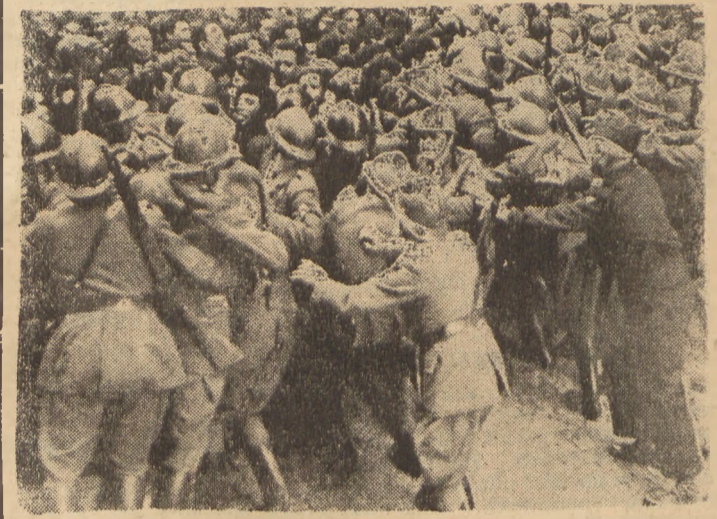
Policja Ramadiera w akcji przeciw demonstrantom w Marsylii, domagających się usunięcia kolaborantów z zarządu miasta.