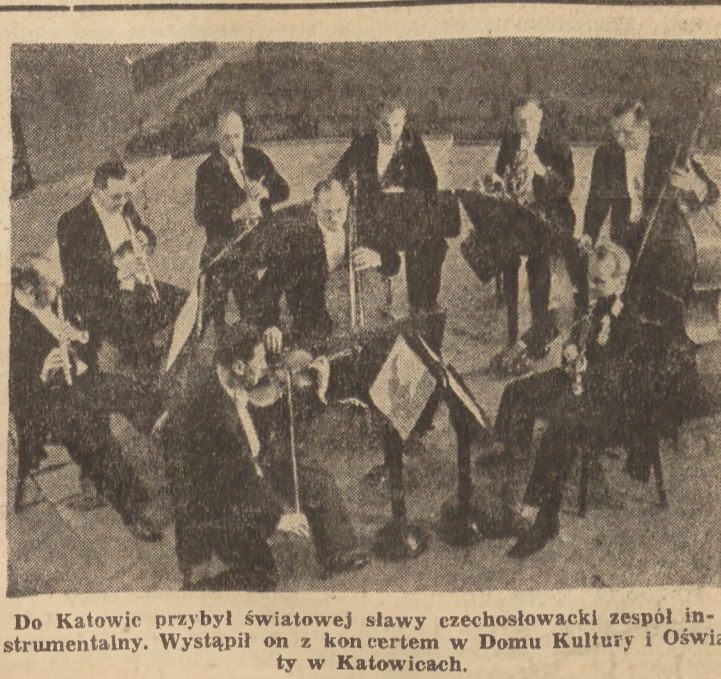
Do Katowic przybył światowej sławy czechosłowacki zespół instrumentalny. Wystąpił on z koncertem w Domu Kultury i Oświaty w Katowicach.

„W obliczu konferencji londyńskiej radziecki zarząd wojskowy pragnie, by poznano istotny stan rzeczy w Niemczech” — zakończył swe oświadczenie marszałek Sokołowski, podkreślając jednocześnie, że rząd radziecki stanowczo domaga się przeprowadzenia uchwał Jałty i Poczdamu, stworzenia zdemilitaryzowanych zjednoczonych i demokratycznych Niemiec.