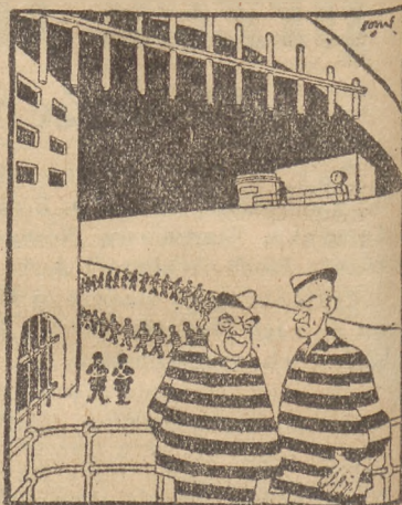
W Sing-Singu: — ... a tamci gwiznęli tyle jugosłowiańskiego złota, i nic im się nie stało...

Bank Federalny w USA zatrzymał bezprawnie złoto jugosłowiańskie o wartości 47 milionów dolarów. Mimo kilkakrotnych interwencji rządu jugosłowiańskiego nie ma dotychczas pozytywnej decyzji.