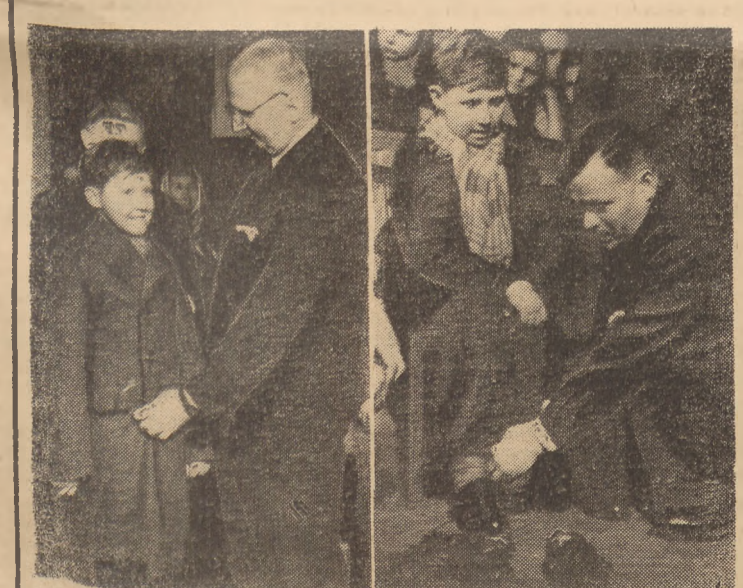
Z funduszu, zebranego na Śląsku dla najbardziej potrzebujących dzieci Warszawy, Stołeczna Rada Narodowa zakupiła 3.000 par butów dziecięcych. Na zdjęciach rozdzielanie darów, wykonanych przez spółdzielnię warszawską.