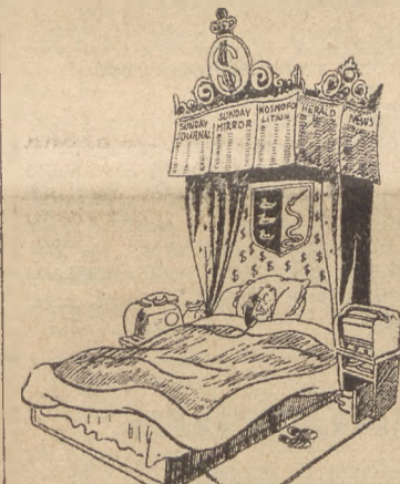
Hearst w karykaturze