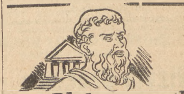
Już Platon mówi!

jej wiekopomnych odkryć w dziedzinie promieniotwórczości. dokłada usilnych starań, aby stworzyć centrum badań energii atomowej