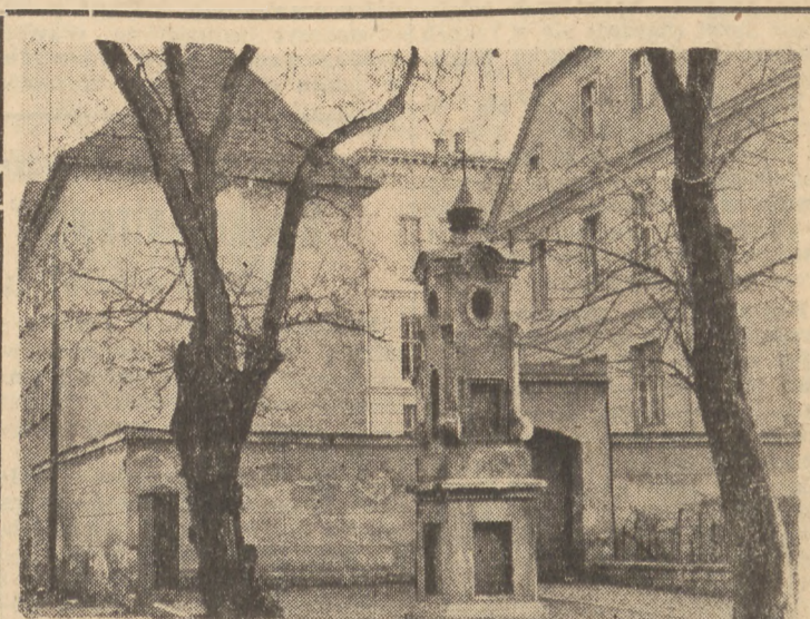
Opole żyje pod znakiem przygotowań do wystawy, obrazującej dorobek ziemi epolskiej w latach 1945—1948. Otwarcie wystawy nastąpi w dniu 31 marca br. Zdjęcie przedstawia gmach gimnazjum im. Jana Kasprzowicza w Opolu, do którego swego czasu uczęszczał wielki poeta.

Przy wynagrodzeniu rocznym ponad 600 tys. do półtora miliona dotychczas od sumy 600 tys. płacono się podatek w wysokości 21%, a od sumy pozostałej od 600 tys. do 1.200 tys. — 40%. Przy wynagrodzeniu ponad 200 tys. rocznie od sumy 600 tys. płacono się 21%, od pozostałej — 50%.