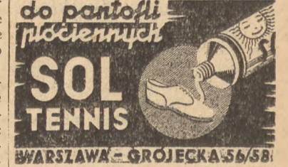
WARSAWA - GROJECKA 56/58

Wzrost przemysłu państwowego Wzrost przemysłu państwowego, regulowane przez państwo.