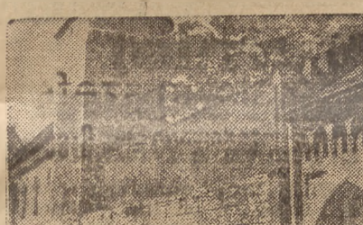
Fragment murów miejskich z basztą Paramoników w Krakowie.

Na Dworcu Głównym w Krakowie otwarta została stacja opieki nad matką i dzieckiem, zorganizowana przez zarząd miejski SOLK.