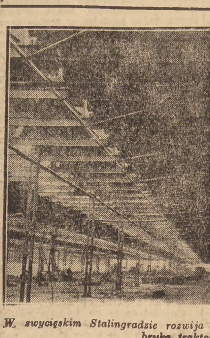
W swyckim Stalingradzie rozwija się pokojowa praca. Oto wielka fabryka traktorów

SOFIA, 18.11 (PAP). — Minister spraw wewnętrznych Antoni Jugow zakomunikował na zgromadzeniu Frontu Ojczyźnianego, że premier rządu jugosłowiańskiego marszałek Tito przybędzie wkrótce do Bułgarii na czele jugosłowiańskiej delegacji rządowej. Podczas pobytu marszałka Tito w Sofii podpisany zostanie jugosłowiańsko-bułgarski pakt przyjaźni i pomocy wzajemnej, który został opracowany podczas wizyty premiera bułgarskiego Dymitrowa w lipcu br.