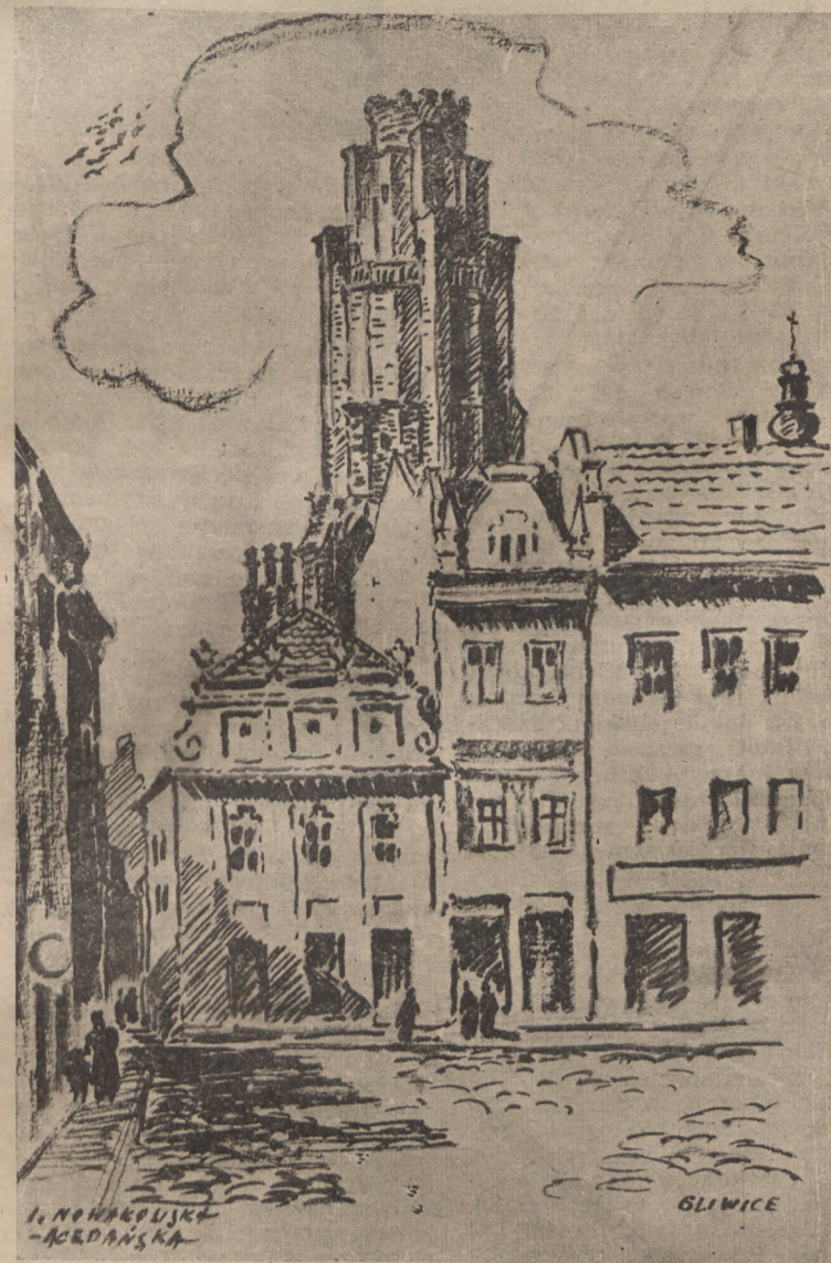
Na rogu ulicy Raciborskiej i Rynku