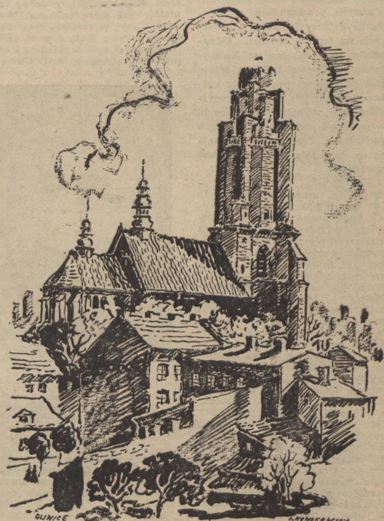
Gotycka fara Wszystkich Świętych w Gliwicach