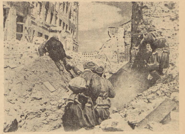
Dnia 19. XI. 1942 rozpoczęła się ofensywa Armii Czerwonej pod Stalingradem. Zdobywając w zacietej walce ulicę za ulicą, Armia Radziecka zbliżała się z każdą godziną do zwycięstwa...