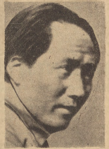
Mao-Tse-Tung, przywódca chińskiej armii ludowej.

Z ostatniej chwili donoszą, że prawdopodobnie strajk sparaliżuje życie nie tylko w portach, ale