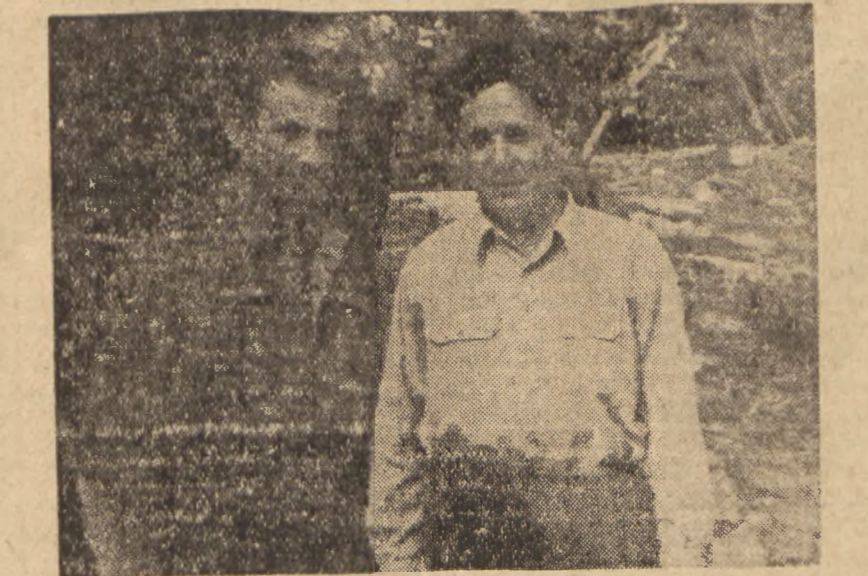
Gen. Markos i Nikos Zachariadis