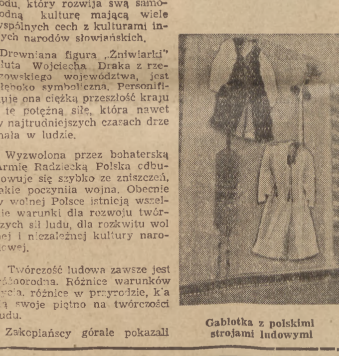
Gablotka z polskimi strojami ludowymi