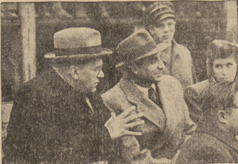
Ambasador Lebediew i gen. Spychalski przyglądają się zawodom.

Program uroczystości obejmuje: składanie raportu, przemówienia, złożenia wieńca przed Pomnikiem Braterstwa Broni, otwarcie marszów i start pierwszych drużyn.