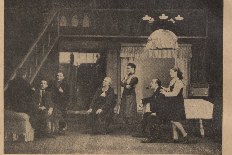
„Wiosna w Norwegii”, sztuka według powieści Stuarta Engstranda w adaptacji Anatola Sterna na scenie Państwowego Teatru Polskiego w Szczecinie