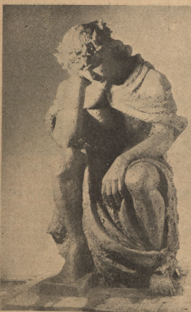
Stanisław Marciniak, Chrystus Frasobliwy