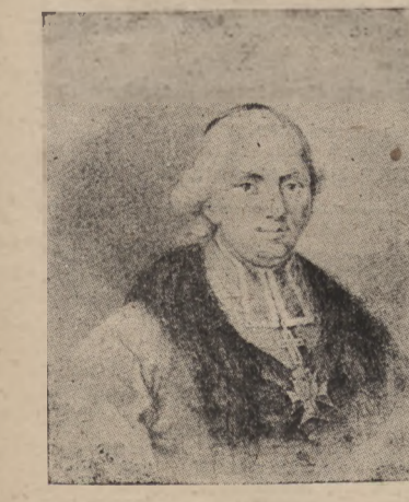
Biskup Ignacy Krasiński

Z listu do pana de Bonstetten o stanie obecnym literatury polskiej.