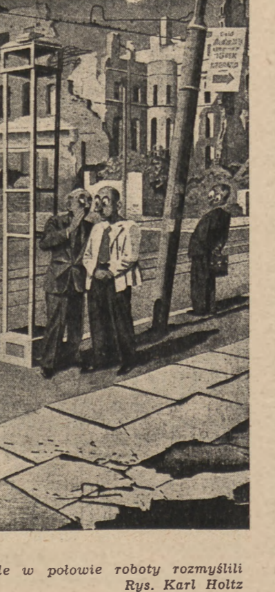
— Na Boga, cóż to? — Ach, i tego chcieli sprzątnąć, ale w połowie roboty rozmyślił się. Rys. Karl Holtz

snu, z zinnym potem na ciele po ostatnich pełnych strachu rojeniach sennych, ujrzał stary wewnątrz chaty na łóżku. Chłop, starzy brodaty, z łagodną twarzą i oczyma dźwięka podawał mu kubek mleka.