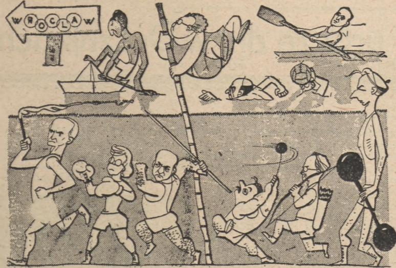
Olimpiada pokoju i postępu (Kulturi Politika)