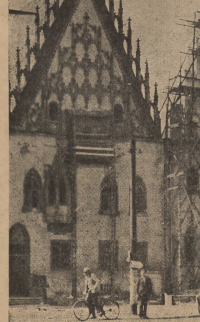
Wrocław historii i pracy...

Na odzieniu i dla każdego Wrocław jest bowiem persk.m jar-