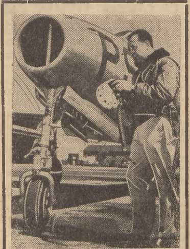
Znany pilot Carl Bellinger przygotowuje się w Farningdale (stan Nowy Jork) do lotu próbnego na nowym typie samolotu odrzutowego „Thunderbolt P 84”. Na podobnym aparacie Bellinger osiągnął w Kalifornii szybkość 621 mil czyli 994 kilometrów na godz.