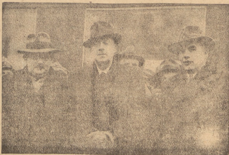
Pełne wykorzystanie tych możliwości zależy oczywiście od narodu polskiego, od pełnej przemiany jego wspólnej zdolności życia, jego pędu ku rozwojowi, w twórczy wysiłek polskiego robotnika, polskiego technika, inżyniera i pracownika wszystkich gałęzi życia.

W dniu 29 bm. powróciła z Moskwy do Warszawy delegacja rządowa z premierem Józefem Cyrankiewiczem na czele. W skład delegacji wchodził wicepremier Gomułka i minister przemysłu i handlu Minc. Delegacji towarzyszyli wiceminister Grossfeld i wiceminister Różański.