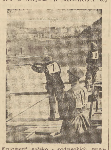
Fragment polsko - radzieckich zawodów w strzelaniu myśliwskim do rzutków, zakończonego zwycięstwem strzelców polskich. Na zdjęciu Polacy na stanowiskach.