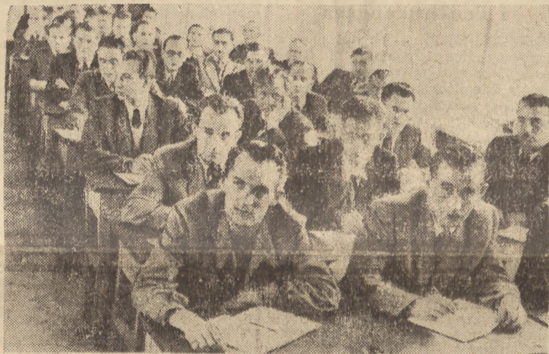
Przed paru dniami rozpoczęła pracę dwuletnia Szkoła Partyjna przy KC PZPR w Warszawie. Na zdjęciu studenci podczas pierwszego wykładu.