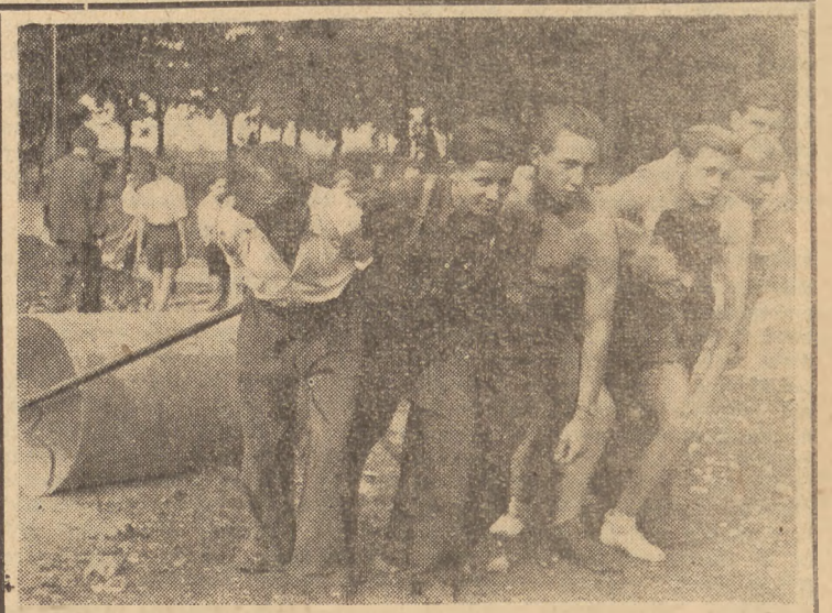
Wkrótce szeregi „SP“ zasila nowe roczniki. Od 18 października do 18 grudnia odbędzie się nowy pobór młodzieży „Służby Polsce“, któremu podlega młodzież męska roczników 1930, 1931 i 1932.