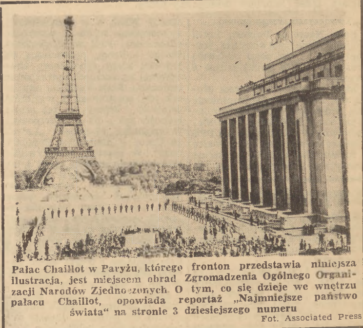
Pałac Chaillet w Paryżu, którego fronton przedstawia niniejsza ilustracja, jest miejscem obrad Zgromadzenia Ogólnego Organizacji Narodów Zjednoczonych. O tym, co się dzieje we wnętrzu pałacu Chaillet, opowiada reportaż „Najmniejsze państwo świata” na stronie 3 dziesiątego numeru

Bevin zniżył się do tego, że zaopozyczył swoje cytaty z brudnych szmat prasy Hearsta.