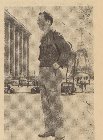
Obywatel amerykański Gary Davis, pilot wojskowy, przebywający we Francji zrzekł się swego obywatelstwa i oddał się pod opiekę ONZ, oświadczając, iż jest obywatelem świata.

dzenia ONZ miejscem pielgrzymek paryżan. Przychodzili obejrzeć upartego kandydata na „obywatele świata”. Kandydatem tym jest 26-letni Amerykanin, Garry Davis, b. pilot.