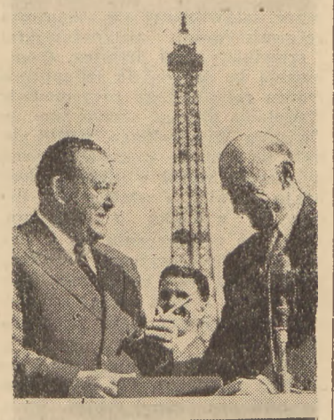
B. premier Schuman wręcza generalnemu sekretarzowi ONZ, Trygve Lie, symboliczny złoty klucz od pałacu de Chaillot.

ku, czy też ten wydatek będzie im się kalkułowal. I wykalkułowali, że tak. Bo na czas trwania sesji ONZ, tj. od września do grudnia, „ONZ-ecja” będzie głową atrakcją Paryża i przyciągać będzie turystów.