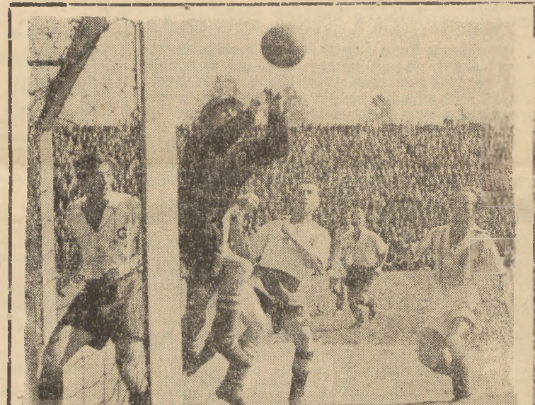
W ub. niedzielę chorzowski AKS pokonał w pięknym stylu krakowską Garbarnię, aplikując jej 6 bramek. Na zdjęciu widzimy jeden z licznych gorących momentów pod bramką Garbarni. Jakubik interweniuje w ostatniej chwili, piaskując piłkę na aut. Obok Muskała, gotowy w każdej chwili wykorzystać ewentualną pomyłkę.

W ub. niedzielę chorzowski AKS pokonał w pięknym stylu krakowską Garbarnię, aplikując jej 6 bramek. Na zdjęciu widzimy jeden z licznych gorących momentów pod bramką Garbarni. Jakubik interweniuje w ostatniej chwili, piaskując piłkę na aut. Obok Muskała, gotowy w każdej chwili wykorzystać ewentualną pomyłkę.