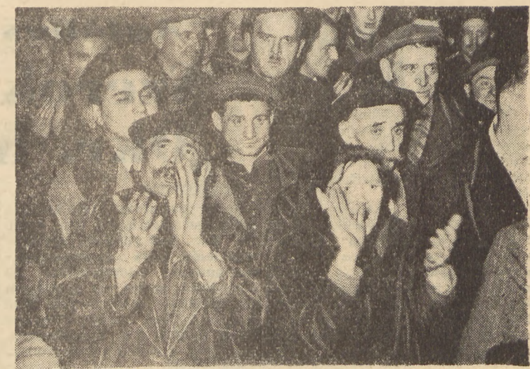
Bezrobotni słuchają mowy, wyjaśniającej przyczyny kryzysu

ści nie mają poparcia Ameryki. A widzieli sami, że Ameryka jest wszechpotężna. Trzeba nam de Gaulle'a... ja wierzę w ludzi. „Człowieczek w binoklach“ W tłumie nastąpiło silne poruszenie. Mały człowieczek w binoklach został nagle otoczony ze wszystkich stron. Twarze wokół niego były chłodne i zamknięte. Zapanowała cisza niezdecydowania. W pewnej chwili szofer z fabryki fortepianów wzmruszył ramionami. — Zostawcie go. Takim małym, nędznym gryziorkiem, których zwalnia się w czasie wojny, potrzeba w czasie pokoju mundurów, potrzebę deflad. My wolimy manifestacje, ponieważ bierzemy w nich samą udział. Ale oni potrzebują pa rad, bo to im dodaje otuchy. Mały człowieczek szła dalej skonfundowany. Powiedział cicho do kierowcy, która w dalszym ciągu robiła na drutach: