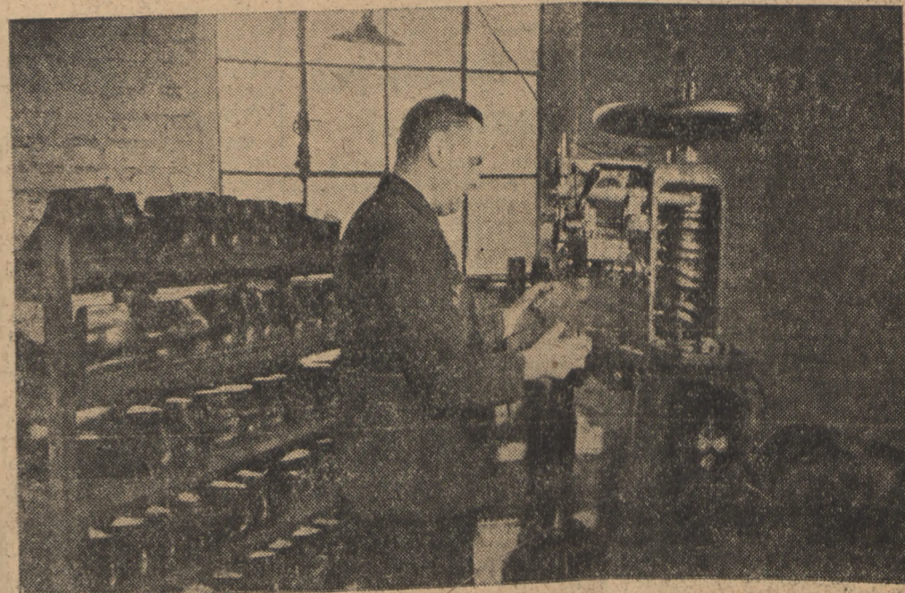
Na zdjęciu: jedna z pracowni państwowej fabryki obuwia w Warszawie. Państwowe fabryki obuwia wykonały ponad plan 1.300.000 par obuwia.

nową Polskę, i masy ludowe dnia jutrzejszego, takich twórców będą uważać za swoich za współtwórców jutra — za przywódców w walce za nas, za ojczyznę, za opiekunów i przyjaźni w rozterkach i bolach.