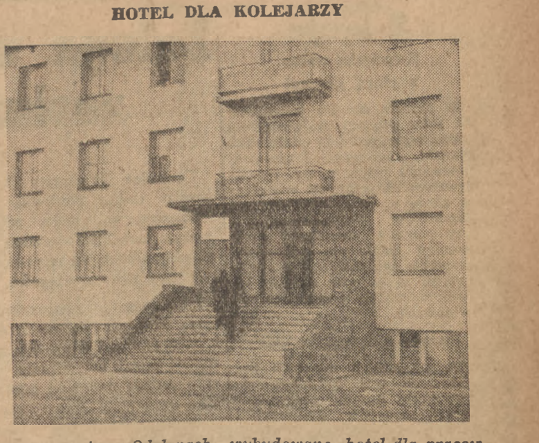
W Warszawie w Odolnnych wybudowano hotel dla pracowników kolejowych którzy są w drodze a nie mieszkają w Warszawie