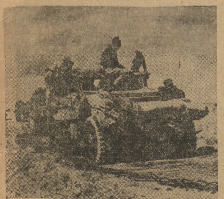
Jydowskie wozy pancerne na pustyni Negev która jest ciałym głównym terenem walk