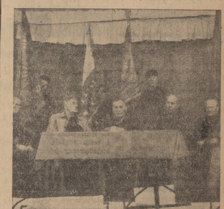
Pracownicy Elektrowni Warszawskiej uroczystie obchodzili czwartą rocznicę oswobodzenia Warszawy. Na fotografii przydium akademii, zorganizowanej z tej właśnie okazji.

Warszawa — Zachód jest jedną z dzielnic, gdzie ilość przedszkoli odpowiada niemal potrzebom. Ogółem jest 11 przedszkoli (9 miejskich i 2 Caritasu), w których może znaleźć miejsce ok. 1000 dzieci.