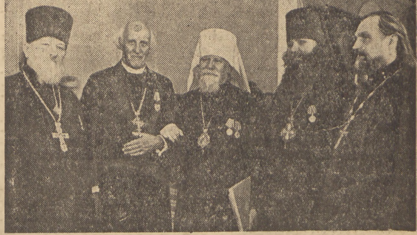
W centralnym parku kultury im. Gorkiego ludność pracująca Moskwy manifestuje na rzecz walki o pokój i postęp (zdjęcie górne). U dołu dziekan Canterbury Hewlett Johnson w otoczeniu duchowieństwa prawosławnego. Obecność jego na kongresie moskiewskim symbolizuje wkład postępowego duchowieństwa w walkę o pokój.